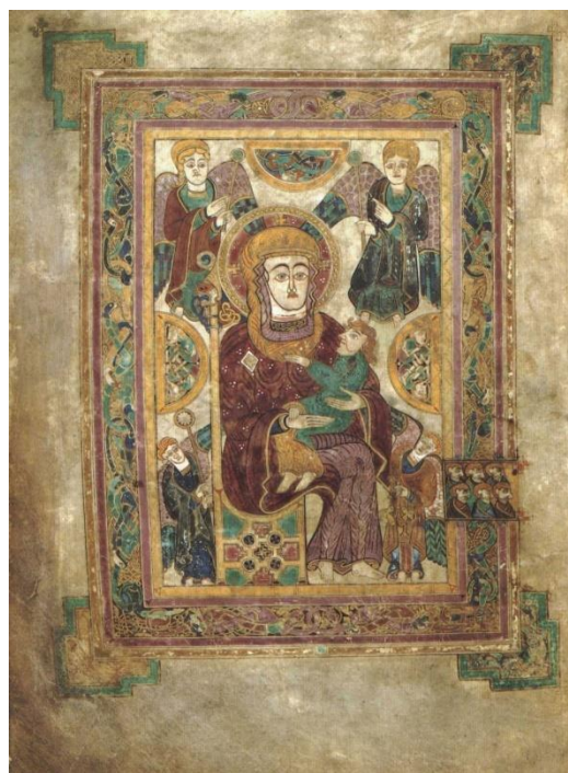
La Vierge à l'Enfant (folio 7v)

d'environ 185 veaux . Elles sont presque toutes faites de vélin , sauf certaines feuilles particulièrement enluminées, constituées d'un parchemin plus épais.